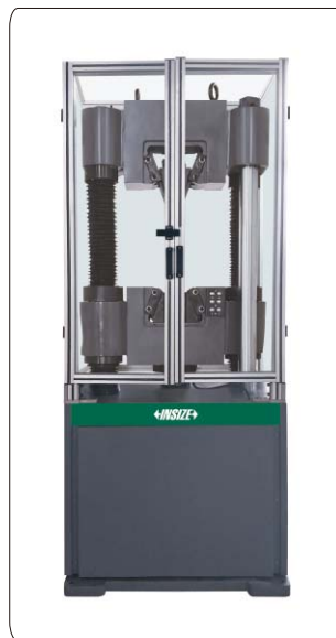
亚克力安全防护罩(选配)