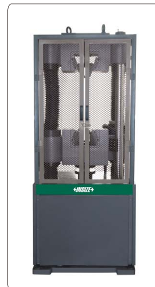
金属网安全防护罩(选配)